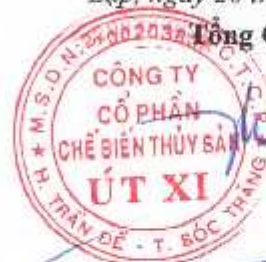
Lý Bích Quyên